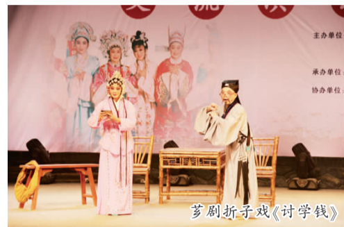
芗剧折子戏《讨学钱》