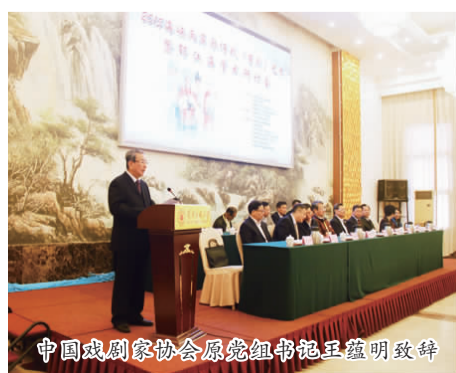
中國戲劇家協會原黨組書記王蘊明致辭

當日下午，研討會分三場分論壇同時進行，並分別圍繞“歌仔戲(芩劇)一代宗師邵江海研究”、“歌仔戲(芩劇)劇本、唱腔、音樂及表演藝術研究和歌仔戲(芩劇)誕生的文化因素、發展歷史及海峽兩岸交流的現狀與未來”、“歌仔戲(芩劇)藝術的創作、表演、劇團發展態勢、兩岸藝術交流”等主題展開積極熱烈的分組研討和總結交流。最後，海峽兩岸歌仔戲(芩劇)藝術暨邵江海學術研討會圓滿落下帷幕。(宣傳部、藝術學院)