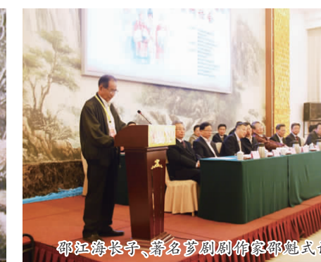
邵江海長子、著名芩劇劇作家邵魁式講話