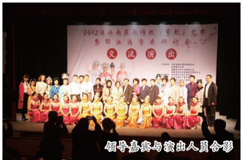
领导嘉宾与演出人员合影