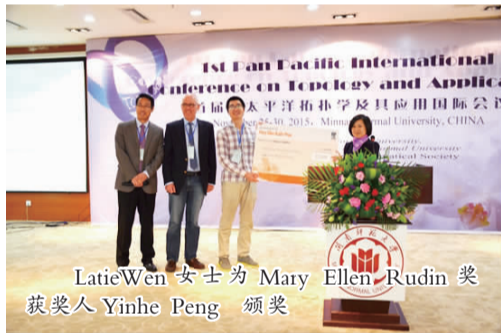
LatieWen女士為Mary Ellen Rudin獎獲獎人Yinhe Peng頒獎